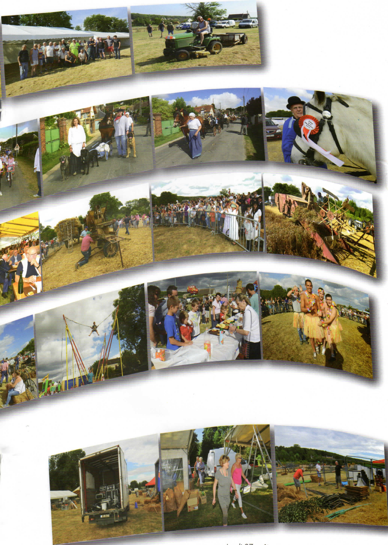
Lundi 27 août A nouveau tous les bénévoles sont au démontage